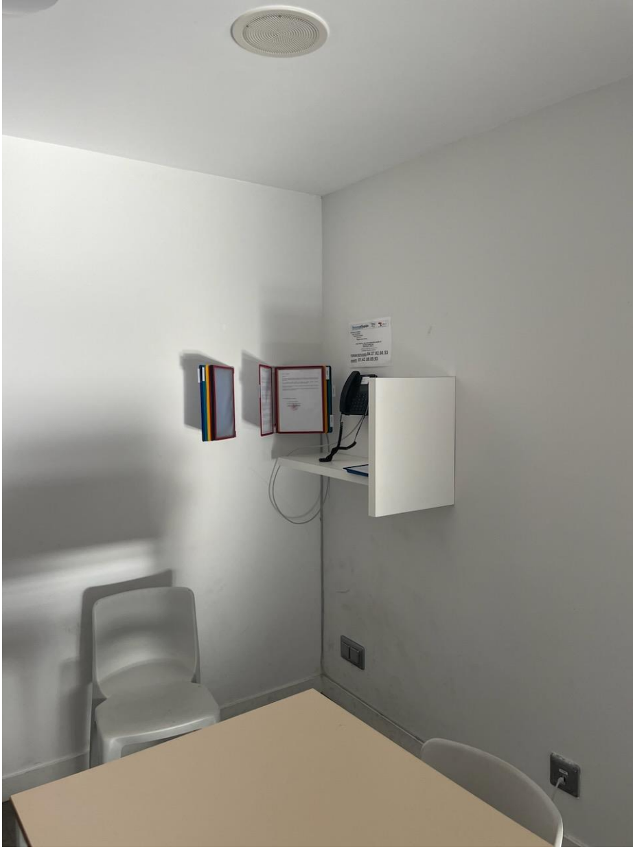
Salle de téléphone