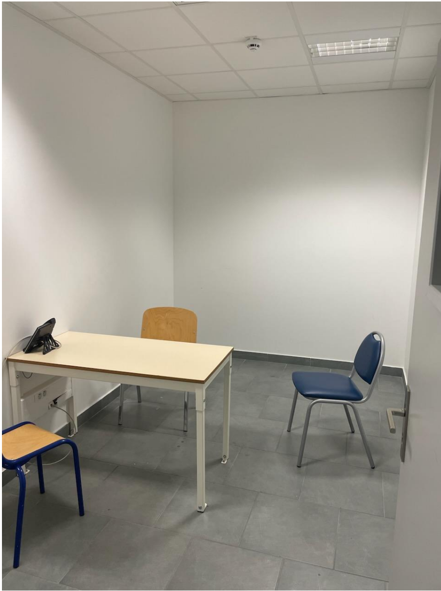
Salle d’entretien avocat