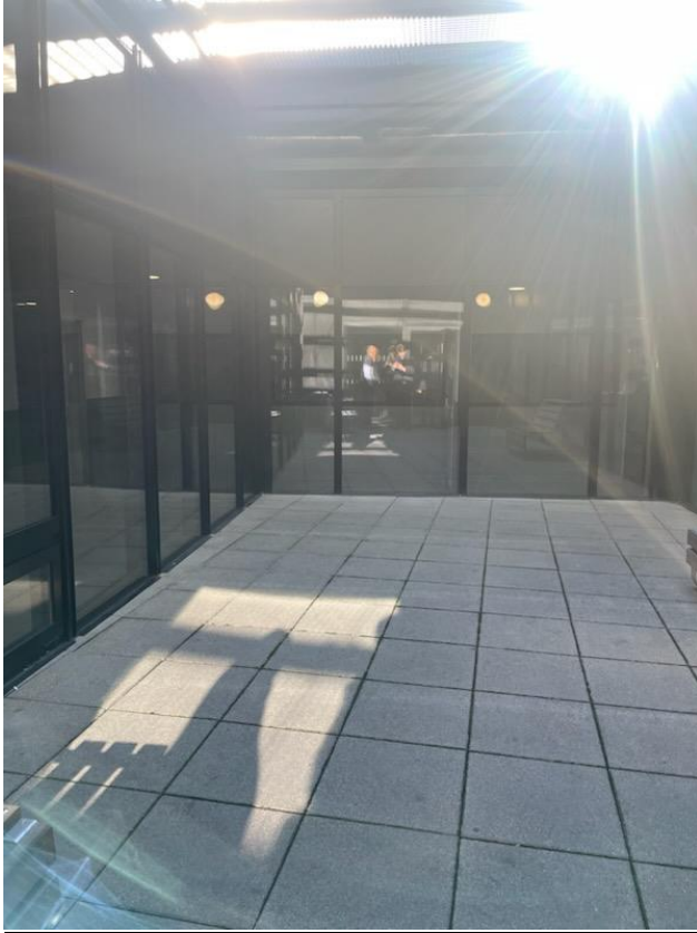
Cour de promenade