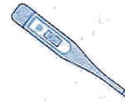
Fièvre > 38°C