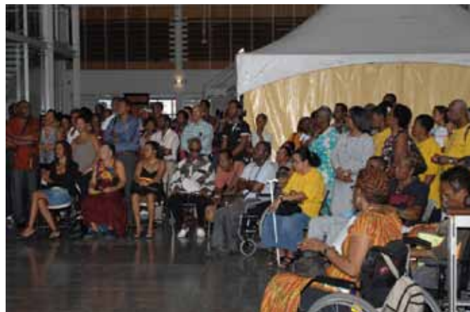
Vue du public assistant à la manifestation