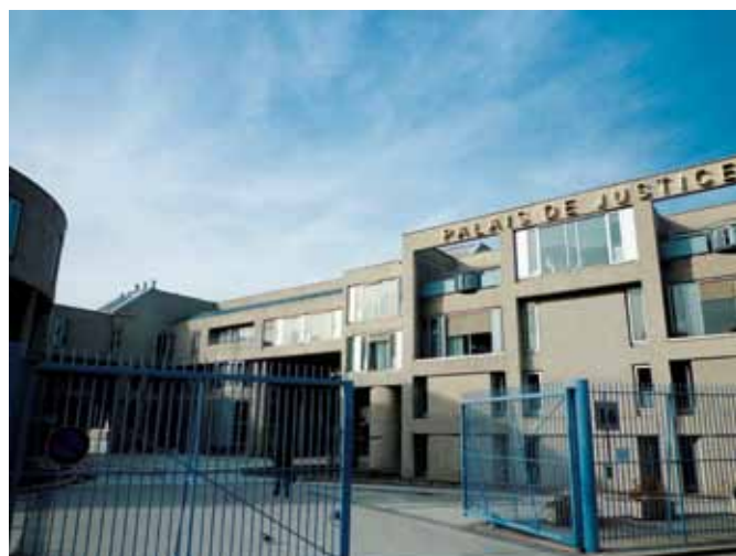
Façade du palais de justice de Clermont-Ferrand

Ces rencontres ont permis de rapprocher les différents acteurs de la vie économique. Les représentants des institutions judiciaires, les experts, les notaires y ont été associés, ainsi, bien entendu, que les universitaires. Deux colloques ont d'ailleurs été réalisés en partenariat direct avec l'université d'Auvergne. Nous