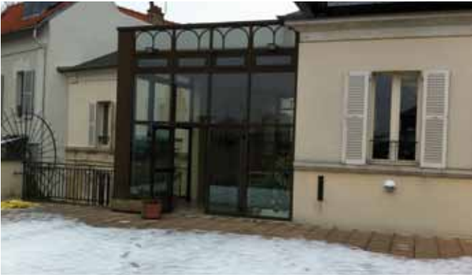
Maison de l'Avocat.

titre de l'aide juridictionnelle ou non.