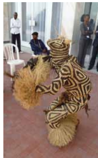
Monsieur le Bâtonnier Alain GUILLOUX a représenté la Conférence des Bâtonniers au 25 ème congrès de la CIB Conférence Internationale des Barreaux (de tradition francophone), qui s'est tenu à KINSHASA du 14 au 19 décembre 2010.