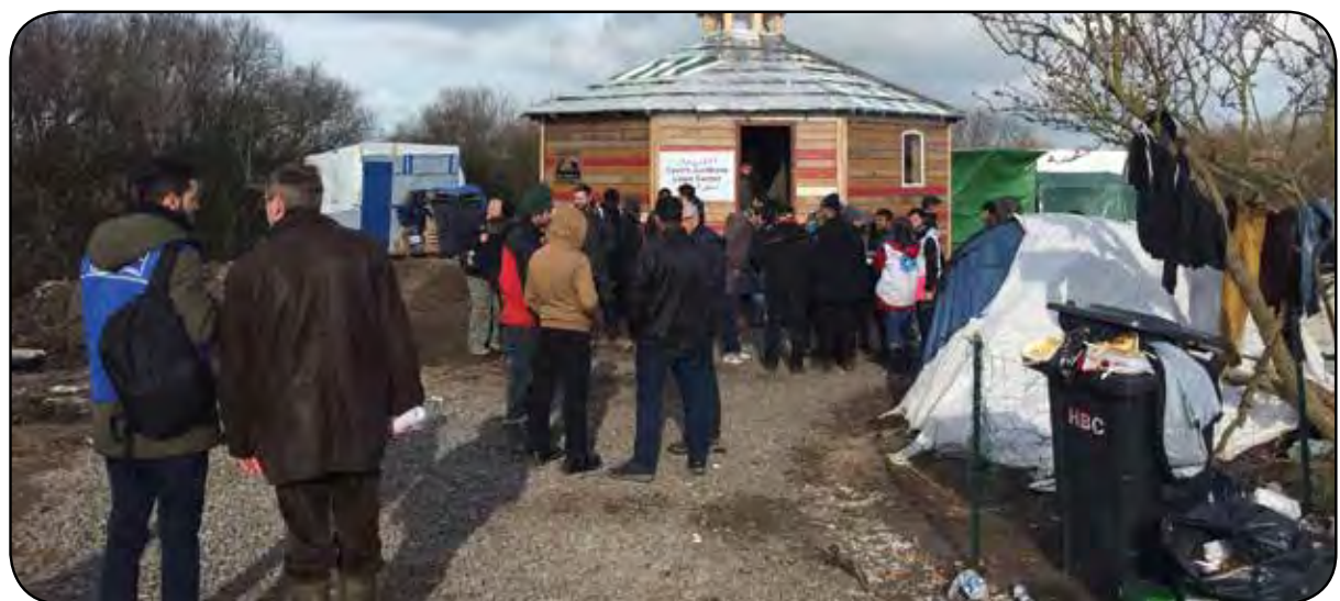
Le « Centre Juridique » dans la jungle (Cabane construite par les « Charpentiers solidaires »)

Ils honorent la Profession et renvoient à nos valeurs montrant ainsi que